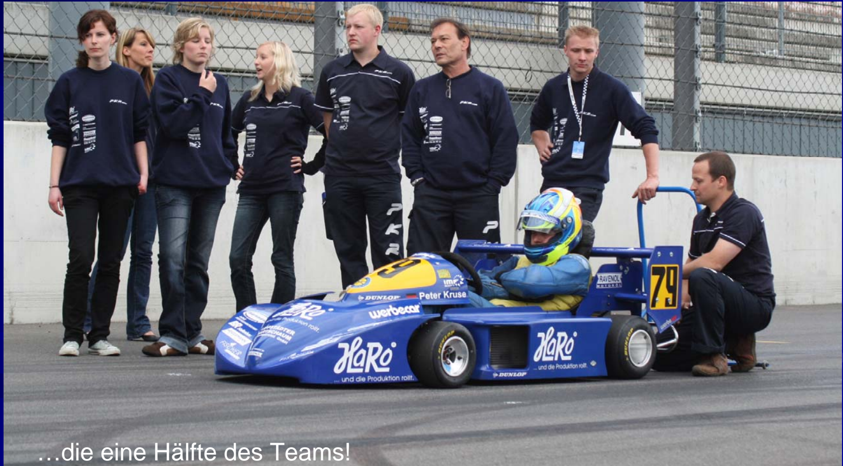
...die eine Hälfte des Teams!